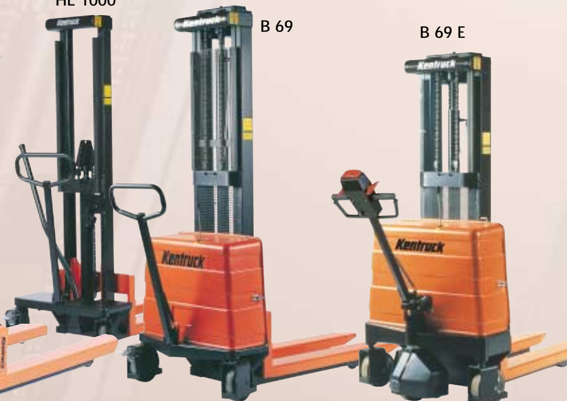
B 69 E

SH finns i många varianter, vi tillverkar även efter kundernas önskemål.