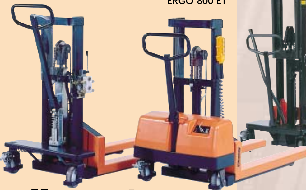
ERGO 800 ET