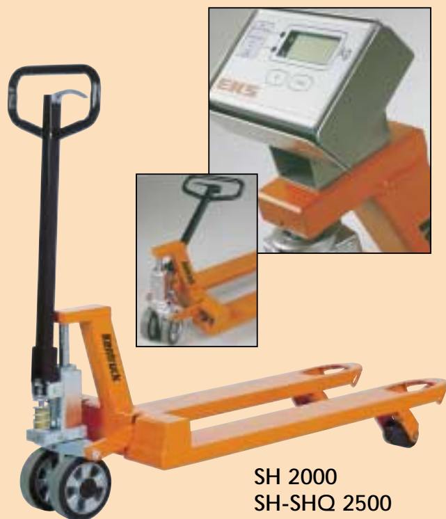
SH 2000 SH-SHQ 2500