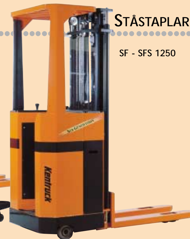
SF - SFS 1250

GX manuell saxgaffelvagn för lyft av gods till rätt arbetshöjd.